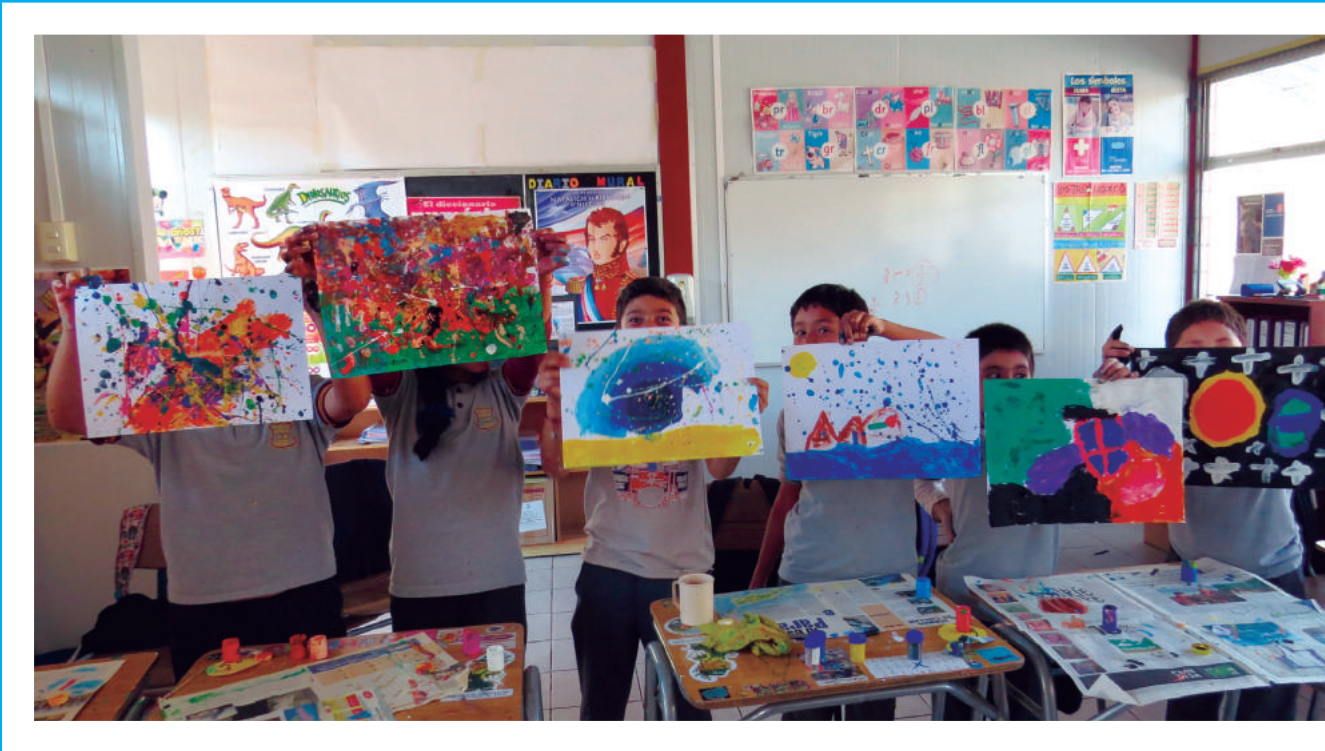
Talleres artísticos Mineduc, Región de Coquimbo 2015

Por otra parte, el arte contribuye a la generación de un tipo de conocimiento valioso por sí mismo que no debe ser visto, únicamente, como complemento al desarrollo de las ciencias y la tecnología. El arte, en la medida en que es abordado desde una perspectiva pedagógica y ética pertinente, puede incidir en “la transformación del entorno personal, escolar y comunitario, y puede contribuir a fomentar la participación social, la creación de cohesión social y la construcción de ciudadanía”. (OEI, 2011, p.100)