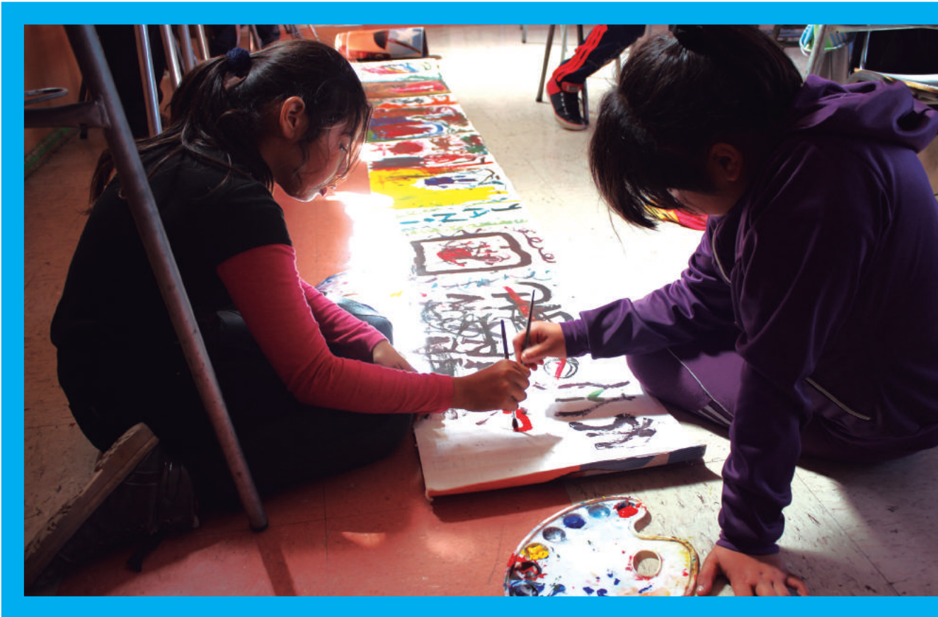
Talleres artísticos Mineduc, Región de Atacama 2015