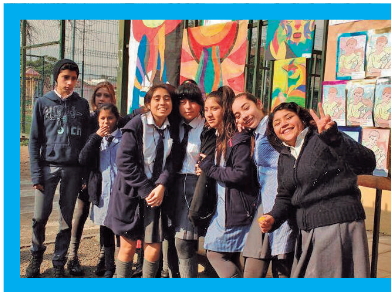
Semana de la Educación Artística Región Metropolitana 2016.

Para estos efectos, el coordinador de gestión solicitará y recibirá directamente de parte de los directores de los establecimientos educacionales las cartas liberatorias de imagen firmadas por los padres o madres de los estudiantes, así mismo de docentes, artistas, autoridades escolares que aparezcan en algún material de difusión de los talleres artísticos.