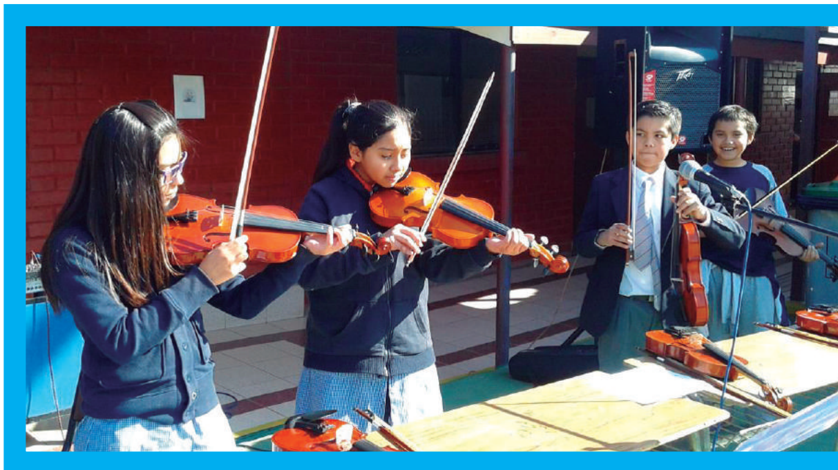
Talleres artísticos Mineduc, Región de Coquimbo 2015

Se sugiere que cada una de estas áreas desarrolle actividades lúdicas, participativas y activas que faciliten la percepción estética y expresión creativa promoviendo habilidades sociales y comunicacionales.