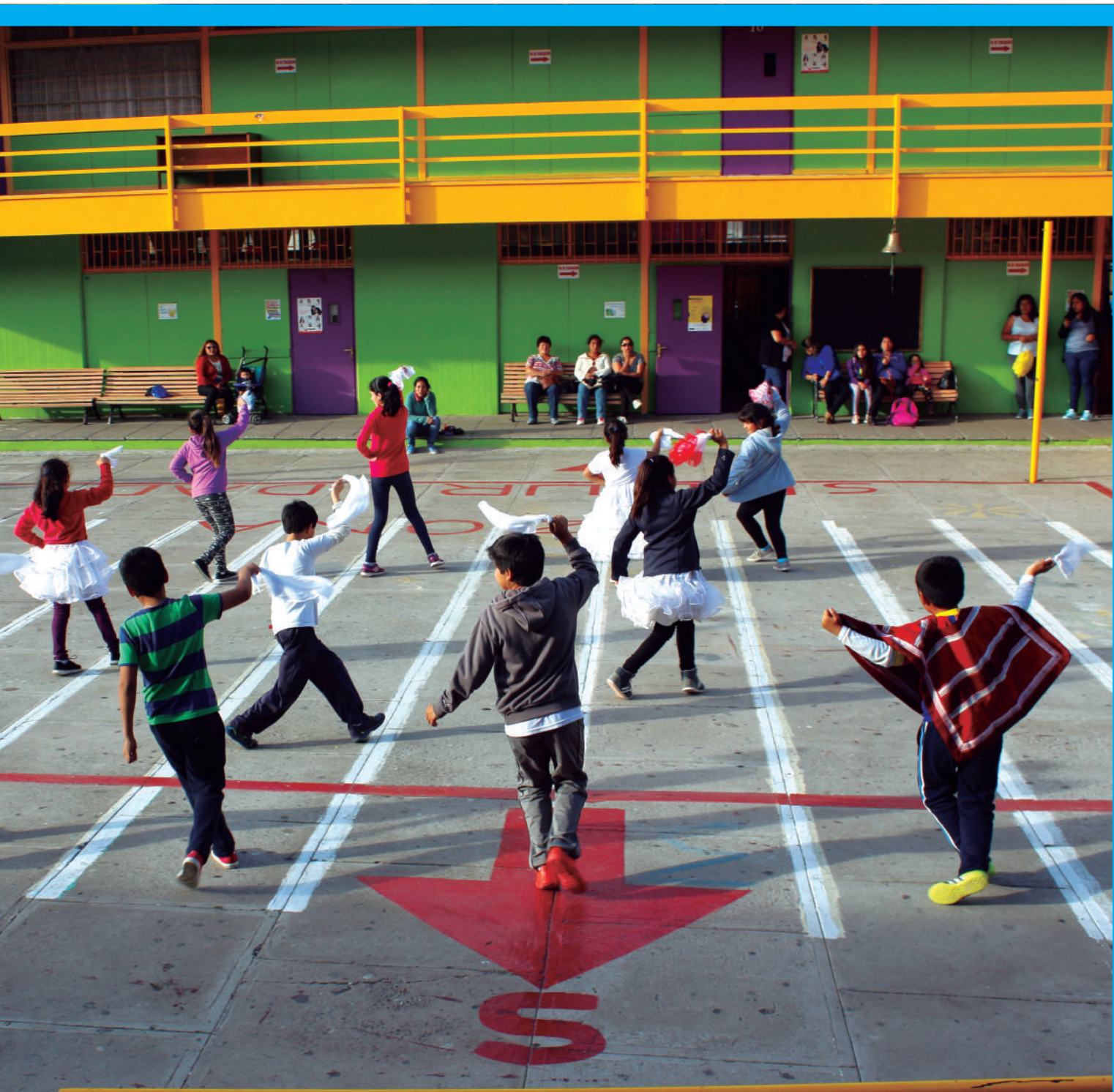
Talleres artísticos Mineduc, Región de Atacama 2015