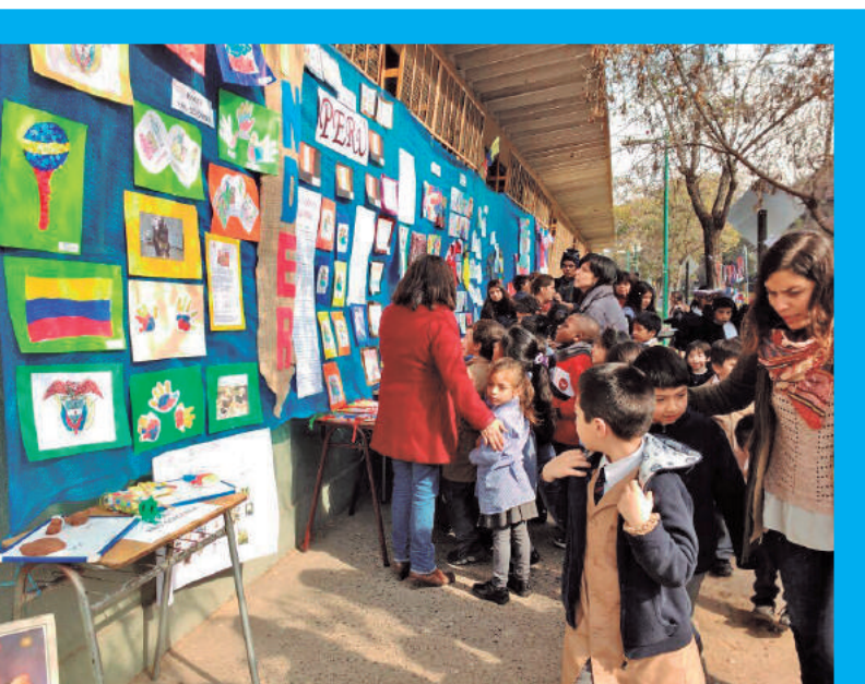
Semana de la Educación Artística Región Metropolitana 2016.

sentido, se favorecerán propuestas que consideren este hito final de manera sistémica generando sinergias. Asimismo, las muestras deben incluir activamente a la comunidad educativa (equipo directivo, docentes, apoderados, y estudiantes tanto de los talleres artísticos como de otros cursos que no cuentan con talleres artísticos) y comunidad local, ya sea como organizadores(as), espectadores(as) o participantes, potenciando las redes locales y/o el espacio público. Para ello se solicita que estas se realicen en el mes de noviembre previa coordinación con el Coordinador Provincial y/o Regional de Educación Artística del Ministerio de Educación.