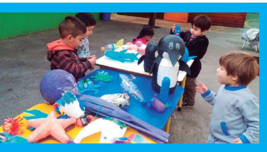
Semana de la Educación Artística Región Metropolitana 2016.