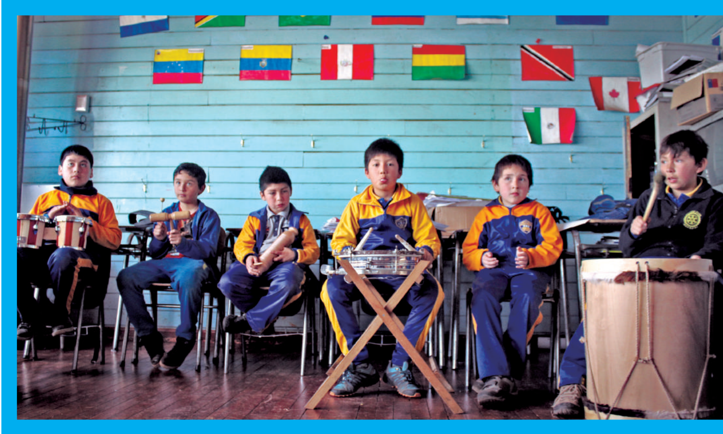
Talleres artísticos Mineduc, Región de Los Ríos 2015.