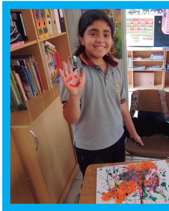
Talleres artísticos Mineduc, Región de Coquimbo 2015