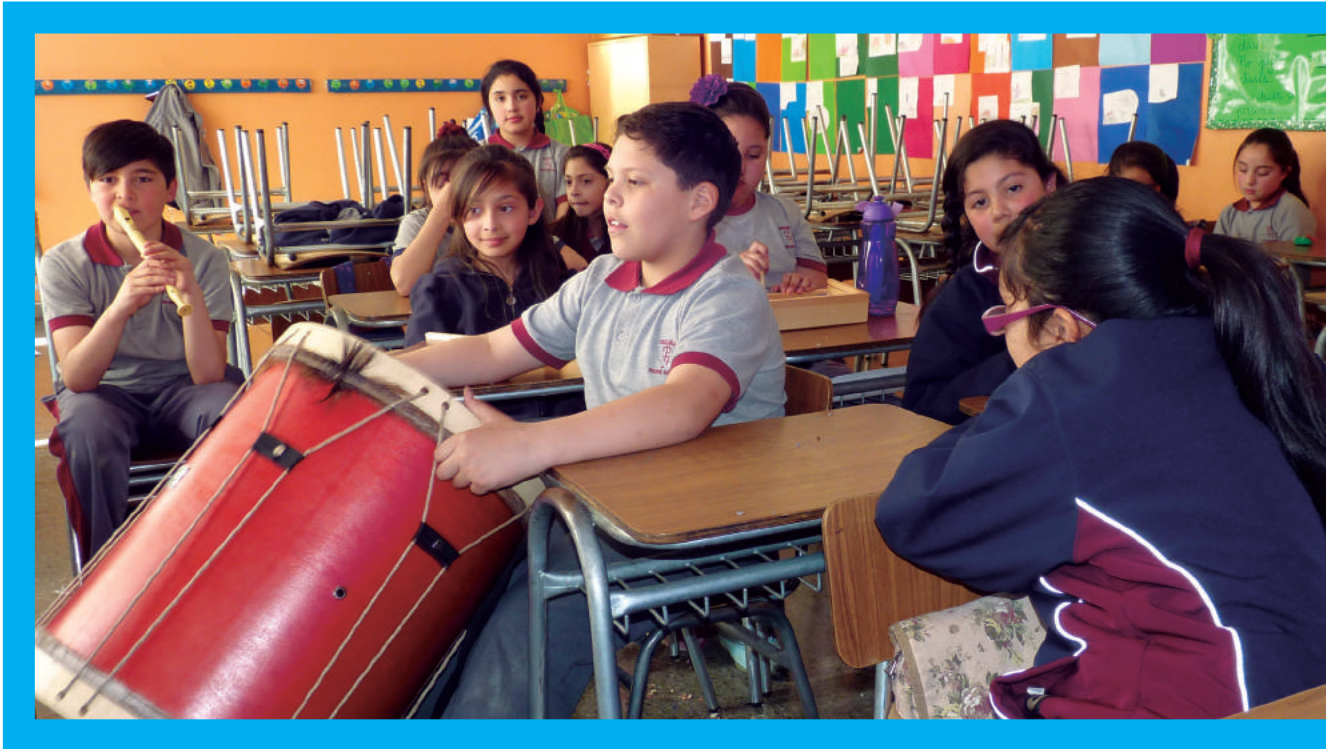
Talleres artísticos Mineduc, Región de Magallanes y de la Antártica Chilena 2015.