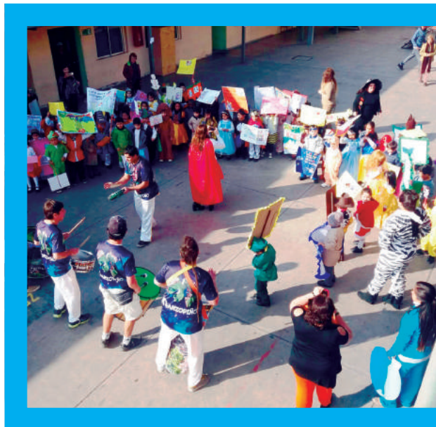
Semana de la Educación Artística Región Metropolitana 2016.

Este enfoque busca además potenciar el proyecto educativo institucional (PEI) de cada establecimiento educacional participante, como una oportunidad de innovación para la gestión institucional de los establecimientos. Esto propicia un mayor vínculo con la comunidad, sobre todo en lugares aislados, aumentando la participación y motivación de los padres, madres y personas adultas responsables, hacia las experiencias artísticas que desarrollan los y las estudiantes. En comunidades rurales y alejadas de centros urbanos importantes, los establecimientos se transforman en núcleos culturales de la comunidad.