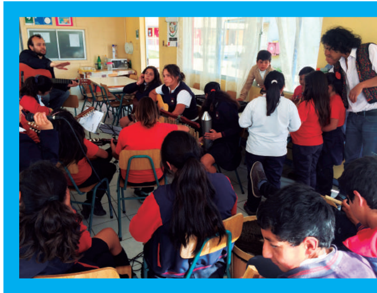
Talleres artísticos Mineduc, Región de Coquimbo 2015

El seguimiento y de evaluación de proceso deben focalizarse en la ejecución de los talleres artísticos en los establecimientos, es decir, se refieren a las actividades que se hubiesen realizado en los establecimientos, preferentemente, con el propósito de conocer y dimensionar la calidad de los procesos de enseñanza, aprendizaje y cantidad de ejecución de los talleres artísticos. Asimismo, se deben considerar las reuniones realizadas con los diferentes actores que intervienen en dicha en la implementación de los talleres artísticos.