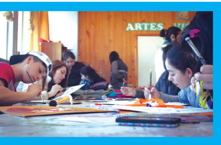
Talleres artísticos Mineduc, Región de Los Ríos 2015.

“En la actualidad se reconoce que el arte es un campo de conocimiento, productor de imágenes ficcionales y metafóricas, que porta diversos sentidos sociales y culturales que se manifiestan a través de procesos de realización y transmisión de sus producciones. Estas últimas se expresan con distintos formatos simbólicos estéticamente comunicables que cobran la denominación de Lenguajes Artísticos, en tanto modos elaborados de comunicación humana verbal y no verbal.” (Argentina, CFE Res. N° 111/10). 2